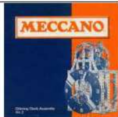
Complete List of Meccano No. 2 Clock Kit Parts