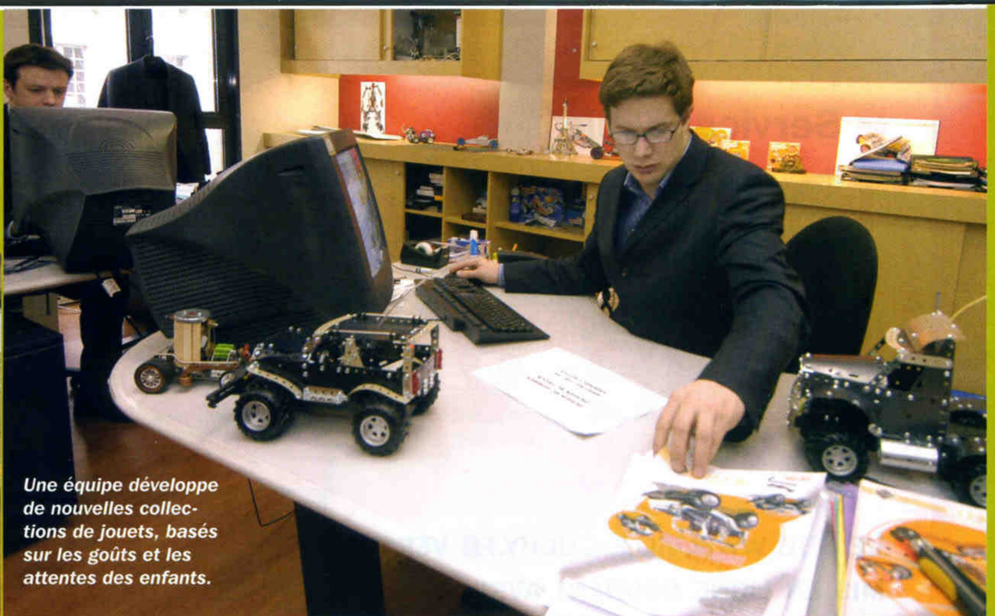
Une équipe développe de nouvelles collections de jouets, basés sur les goûts et les attentes des enfants.