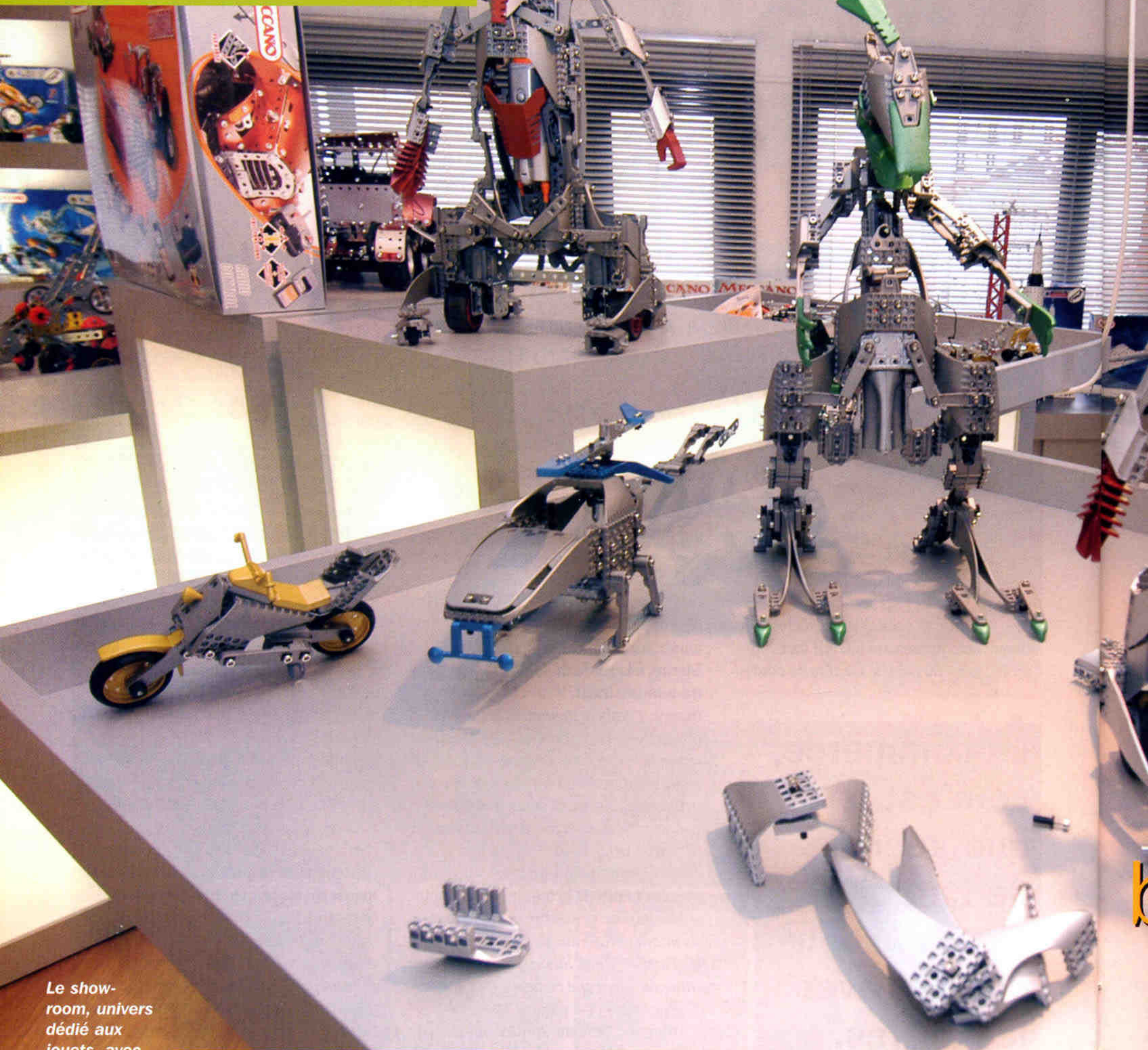
Le show-room, univers dédié aux jouets, avec la marque Meccano en chef de file.