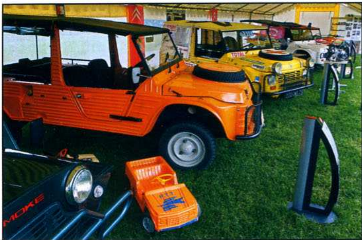
Sous une tente spécifique, des modèles emblématiques étaient exposés ; on trouvait également des voitures de marques concurrentes mais d'esprit similaire, comme la Mini Moke anglaise (qu'on aperçoit à gauche).