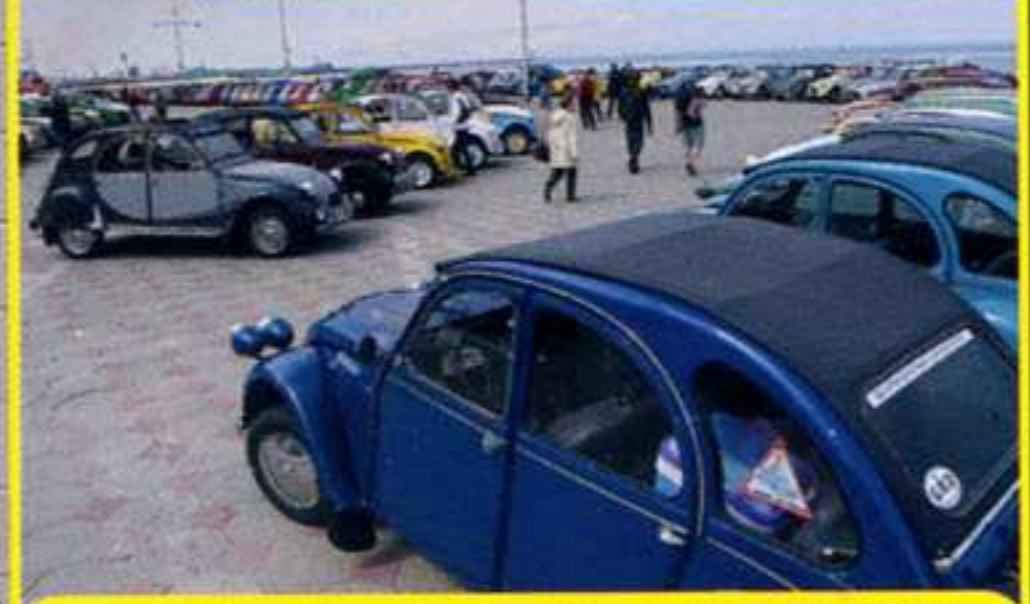
16 ème Nationale 2CV (59)