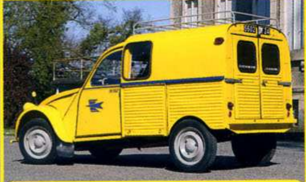
2CV AZU PTT - 1967