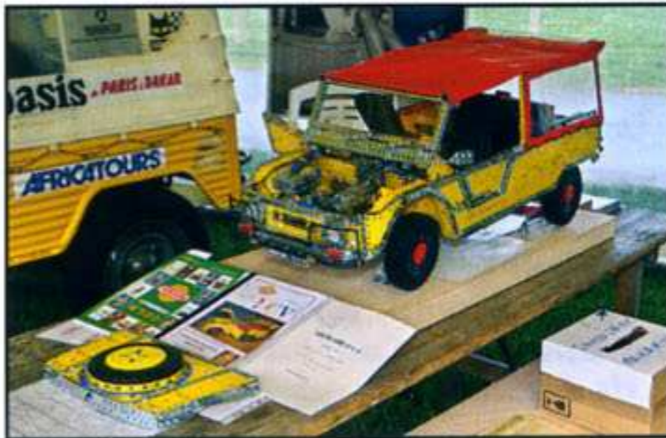
Le Meccano... tout le monde connaît ! Et bien voilà ce qu'on peut réaliser avec un brin d'imagination, un peu de temps et beaucoup de patience.