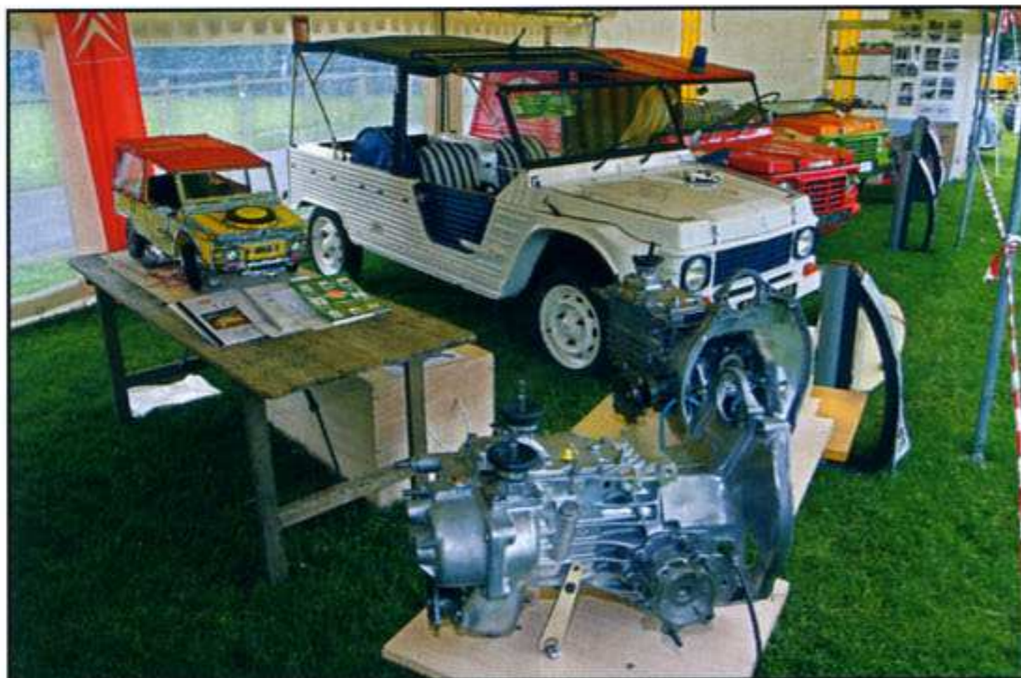
Derrière ces boîtes de vitesses, on voit une Méhari Azur, la série spéciale de 1983 (700 exemplaires avant d'être intégrée au catalogue), reconnaissable à sa livrée bleue et blanche et à ses jantes ajourées.