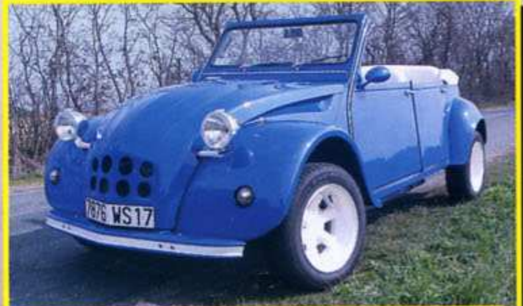
À vous la parole : Cabdeuch