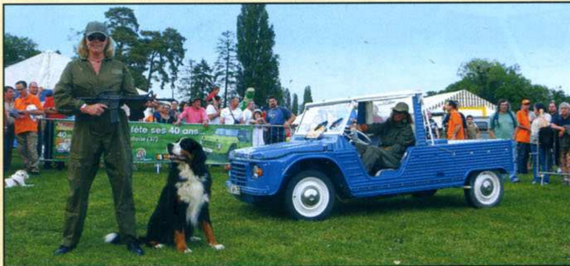
Méhari bleue, tenue militaire, chien de garde et mitrailleuse : 40 ans plus tard, deux des mannequins présents à Deauville en 1968 ont bien voulu refaire le Show devant des spectateurs comblés.