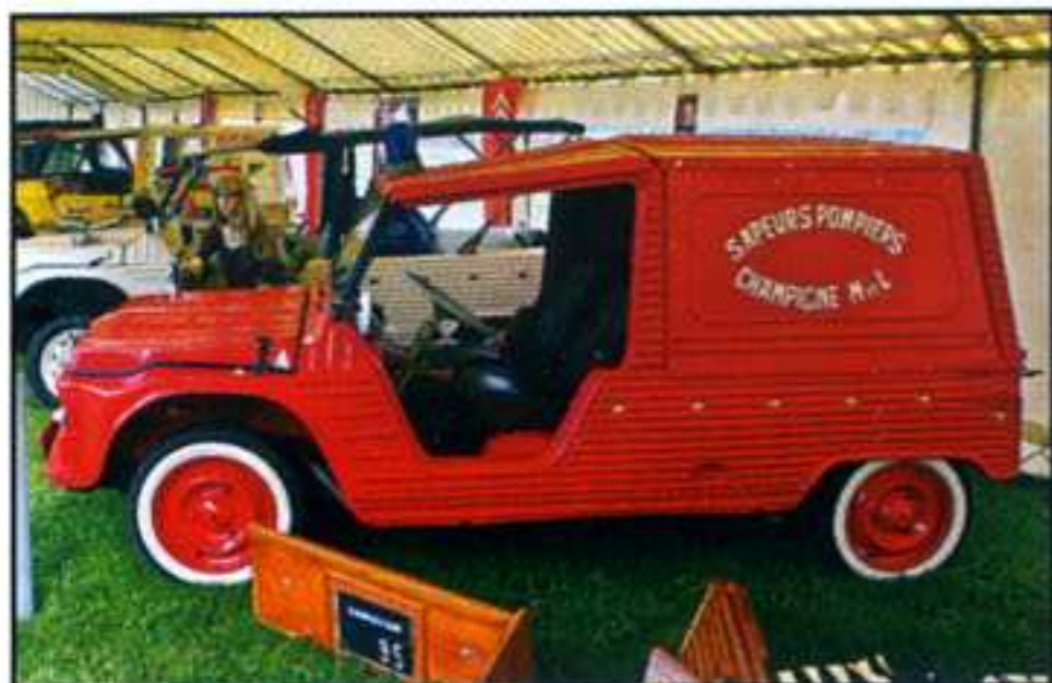
Cette rare Méhari, fabriquée par la SEAB en 1968, a été reconditionnée en 1970 pour servir dans la brigade de Champagné (49).