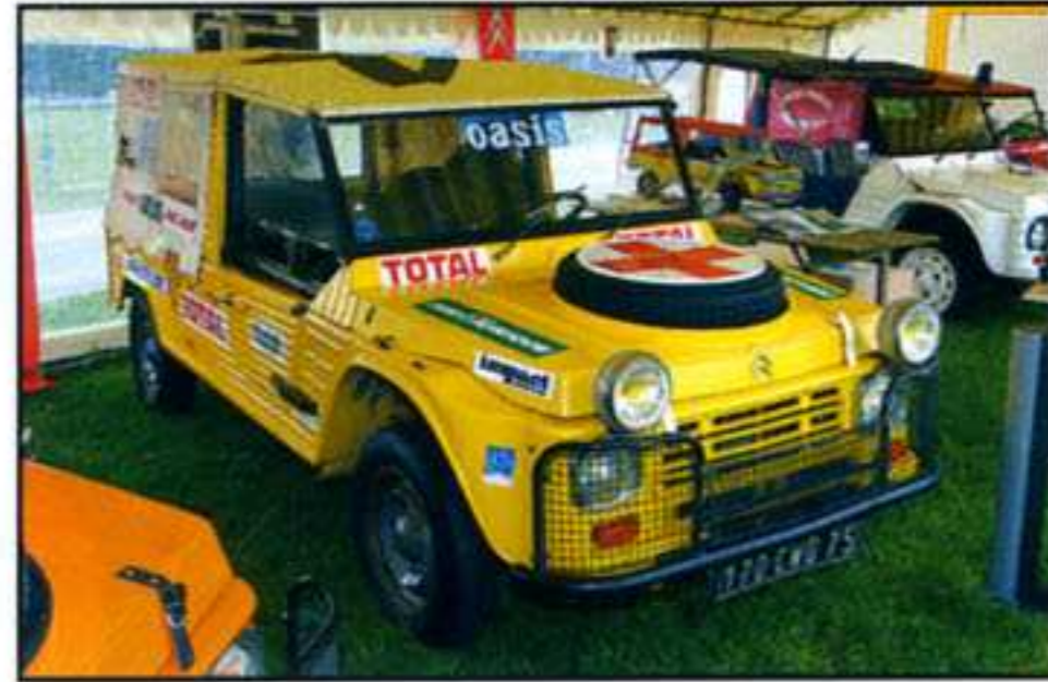
Au Paris-Dakar de 1980, dix Méhari comme celle-ci (prêt du Conservatoire Citroën) ont été préparées pour l'Assistance médicale.