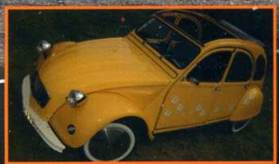
CUSTOM 2 CV Tahi-Moon