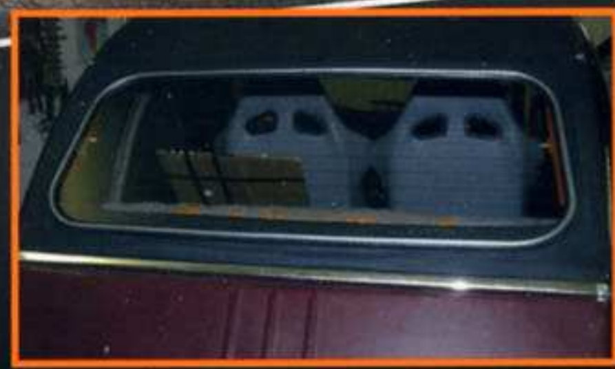
TECHNIQUE Une lunette arrière chauffante

France METRO : 5 € - BEL/LUX : 6,50 € - DOM : 5,60 € - PORT, CONT. : 6,98 € - TOM/S : 7,00 XPF