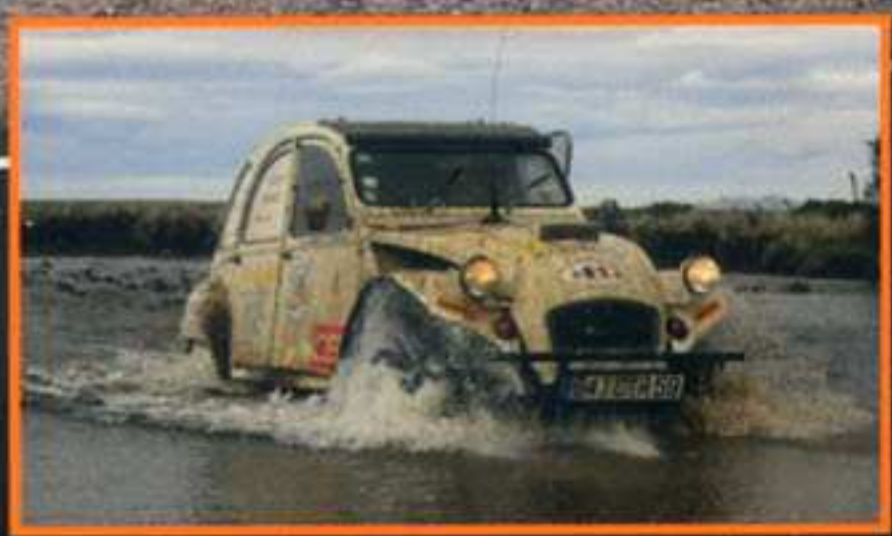
RAID La Patagonie en 2 CV