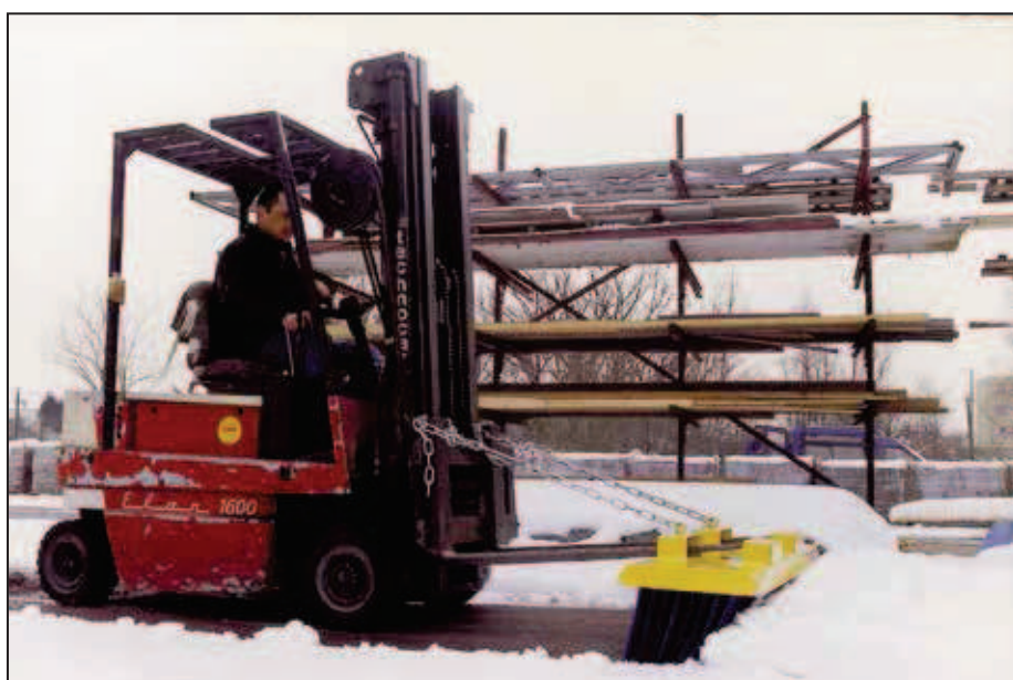
Version économique et dimension uniques 1,50 m