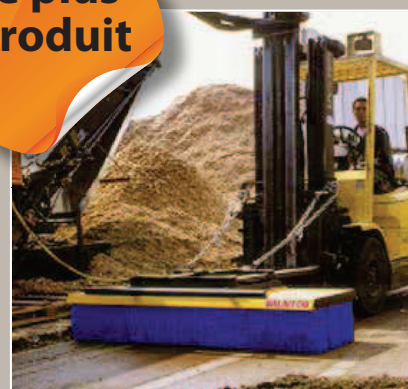
Deux chaînes de maintien permettent le balayage en marche avant et en marche arrière