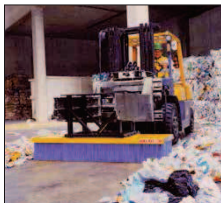
Version pince à balle