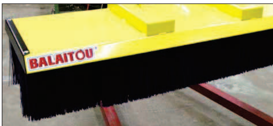
Modèle dix rangées