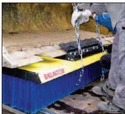
Adaptation sur un godet