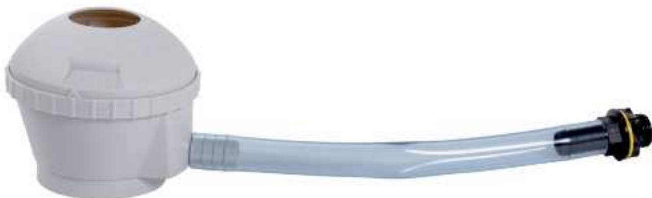
Kit collecteur filtrant universel