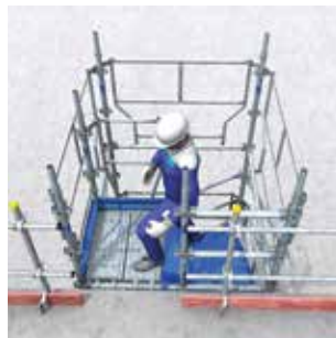
Volées 3 marches. Escalier accolé à l'existant avec sortie latérale.