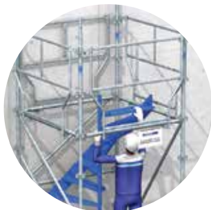
Mise en place des volées

Grâce à son garde-corps MDS et à sa trappe de montage spécifique, l'Hélicrab peut être monté et démonté en totale sécurité. Le faible poids des pièces facilite par ailleurs un montage manuel.