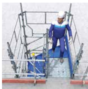
Volée 2 marches. Escalier accolé à l'existant avec sortie de face.

D'autres solutions présentées dans la notice technique permettent des hauteurs supérieures.