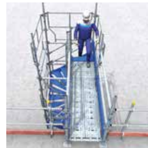
Volées 3 marches. Escalier éloigné de l'existant avec sortie en passerelle.