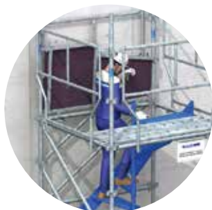
Sécurisation avec trappe de montage