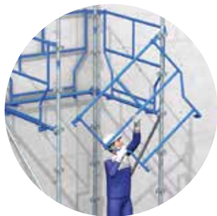
Pose des garde-corps MDS

Grâce à son garde-corps MDS et à sa trappe de montage spécifique, l'Hélicrab peut être monté et démonté en totale sécurité. Le faible poids des pièces facilite par ailleurs un montage manuel.