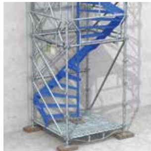
Entrée de face.