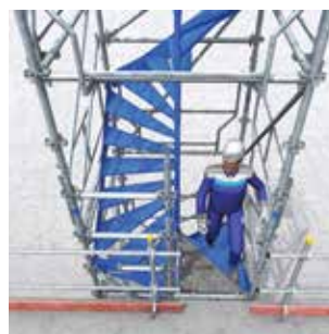
Volée 2 marches. Escalier accolé à l'existant avec sortie intermédiaire de face. Départ vers l'étage supérieur à l'aide d'une bague 2 étriers et d'une volée 2 marches.

Ces quelques exemples de sorties ne sont qu'une infime représentation des multiples possibilités de l'Hélicrab.