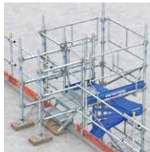
Escalier accolé à l'existant avec rattrapage du niveau de dalle. Compatibilité avec l'escalier acier Crab pour réaliser la retombée.