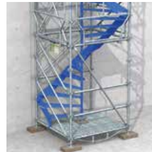
Entrée latérale droite.