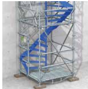
Entrée latérale gauche.