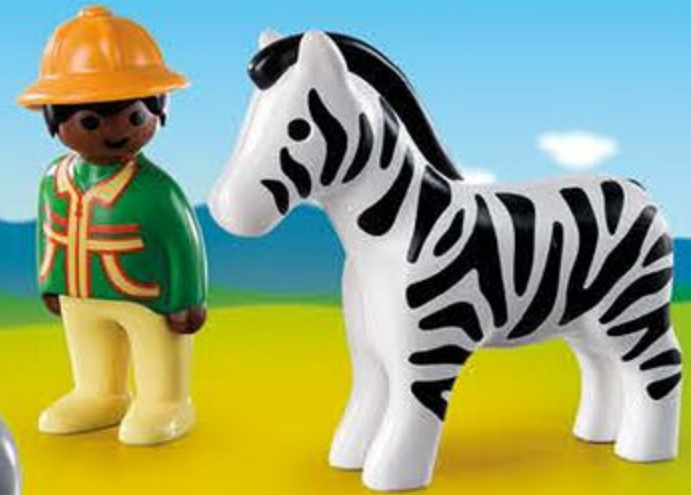
9257 Soigneur avec zèbre