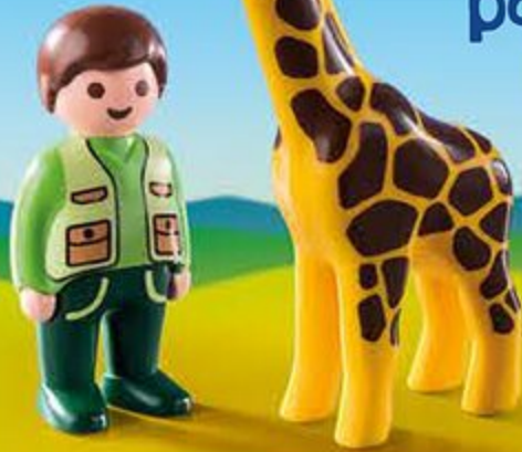
9380 Soigneur avec girafe