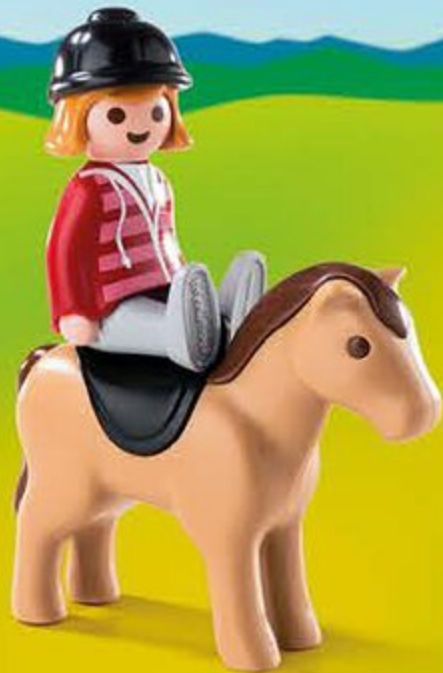
6973 Cavalière avec cheval