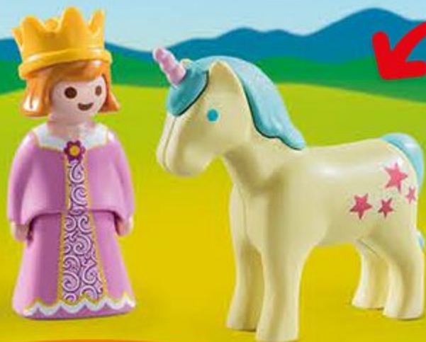
70127 Princesse et licorne