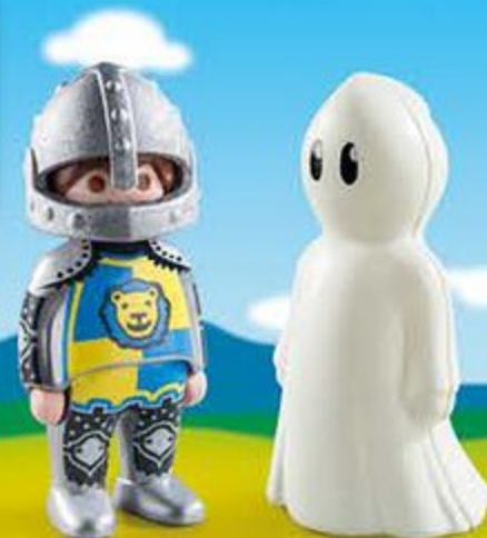
70128 Chevalier et fantôme