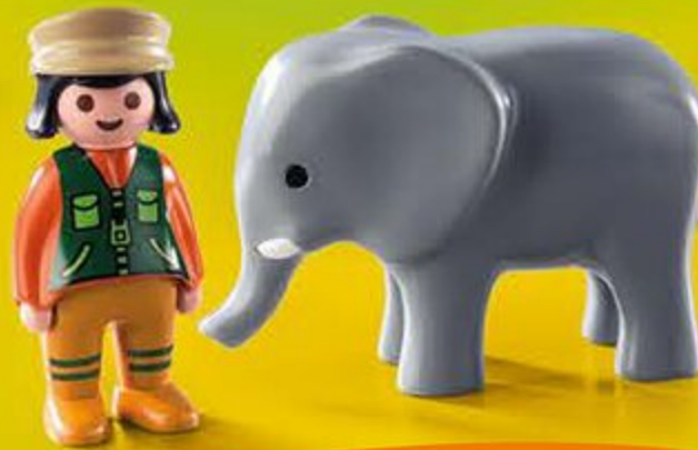
9381 Soigneuse avec éléphanteau