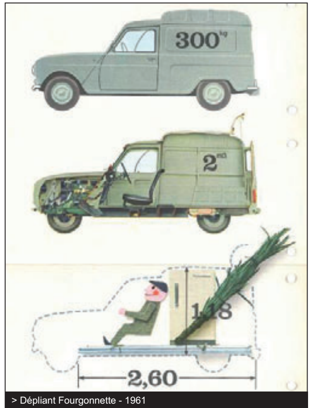
> Dépliant Fourgonnette - 1961