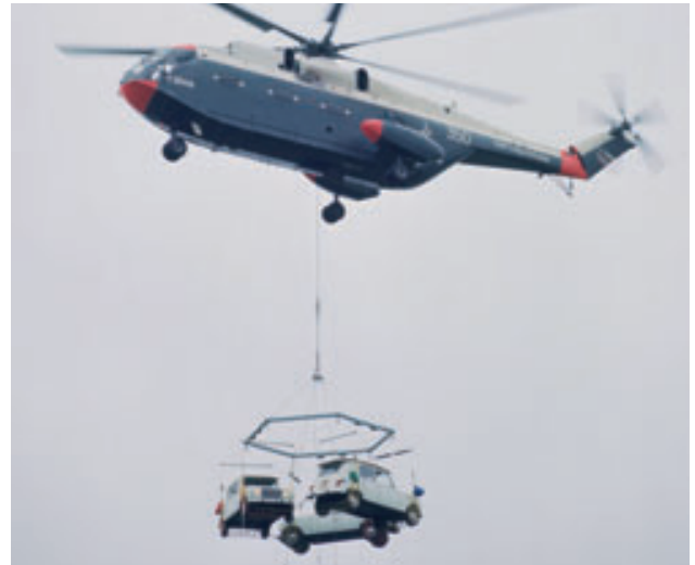
> Insolite - 1971

L'automobile aura son jean. Et Pierre Dreyfus commence par en fixer le prix. Ce sera 350 000 francs, et pas un sou de plus ! Le message est si net que les concepteurs vont tout bonnement appeler le projet «la 350». Autant dire que l'étude de la voiture part d'un coût, soit une méthode tout à fait inhabituelle pour l'époque.