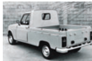
> Pick-up - 1978

A partir de juillet, le tableau de bord de la Renault 5 équipe la gamme Renault 4. Les moteurs 782 cm 3 cèdent le pas aux 845 cm 3 qui développent la même puissance que le 1 102 cm 3 .