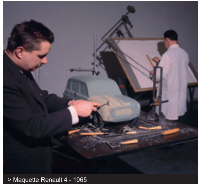
> Maquette Renault 4 - 1965