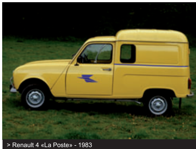
> Renault 4 «La Poste» - 1983

Et la raison en est simple : la 4L est devenue un produit culte et intemporel. Le jean de l'automobile !