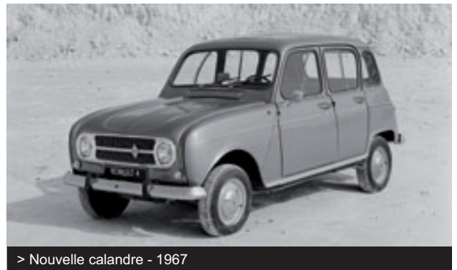
> Nouvelle calandre - 1967