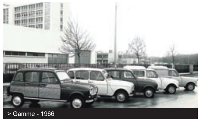
> Gamme - 1966

La Renault 4 bénéficie d'un rapport de plus avec une boîte à 4 vitesses. Septembre 1967 (année modèle 1968), la Renault bénéficie d'un rapport de plus avec une boîte à 4 vitesses et présente une calandre plus large englobant les projecteurs.