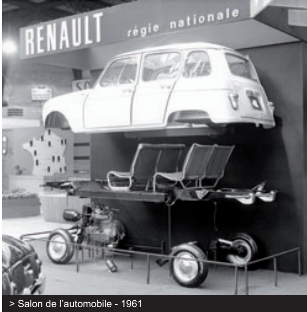
> Salon de l'automobile - 1961