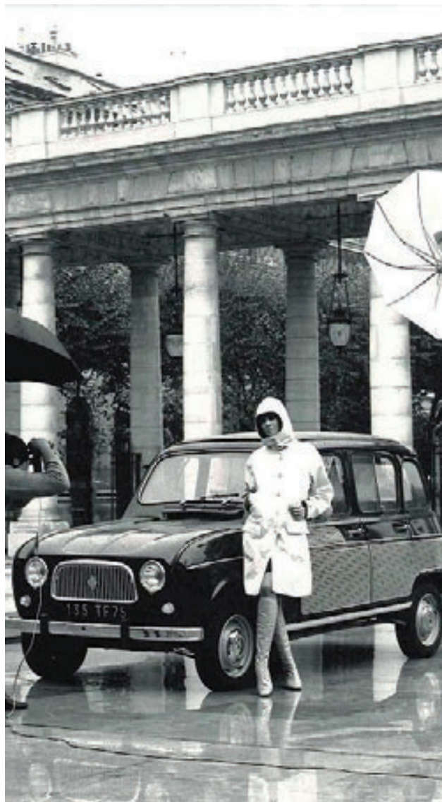
> Renault 4 «Parisienne» - 1963