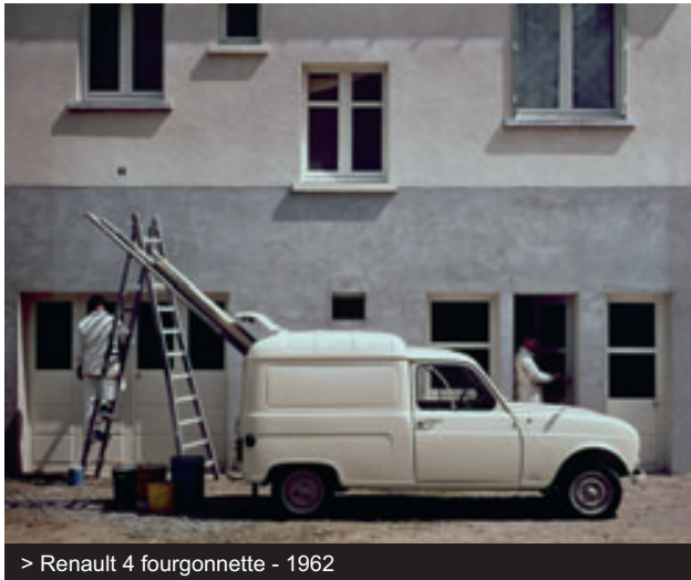
> Renault 4 fourgonnette - 1962