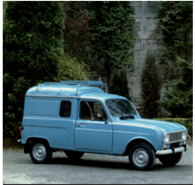
> Renault 4 Service «EDF GDF» - 1983