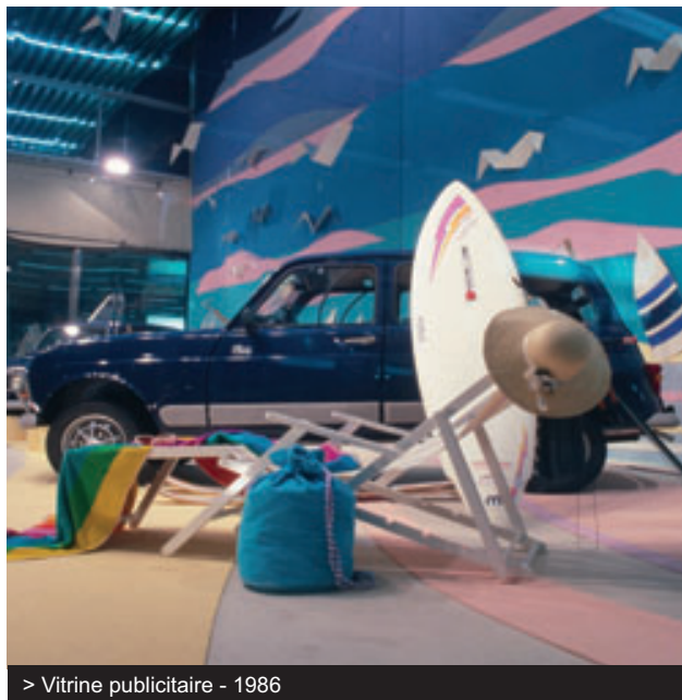
> Vitrine publicitaire - 1986