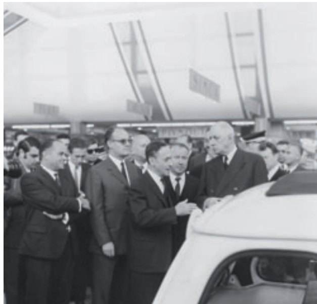
> Pierre Dreyfus et le Général De Gaulle - 1966

Si le jean ne se repasse pas, la Renault 4 n'a plus de contraintes d'entretien : fini les points de graissage et le niveau d'eau à surveiller : la mise au point d'un circuit scellé de refroidissement avec vase d'expansion met fin aux risques de surchauffe.