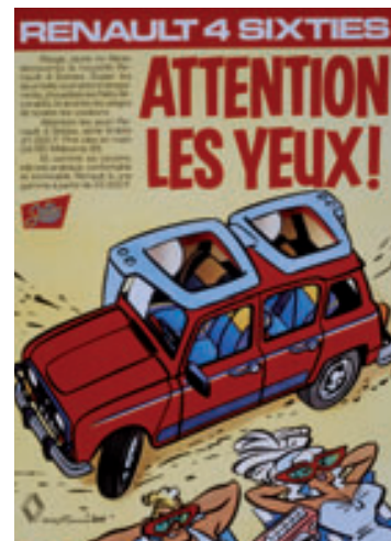
> Publicité - 1985