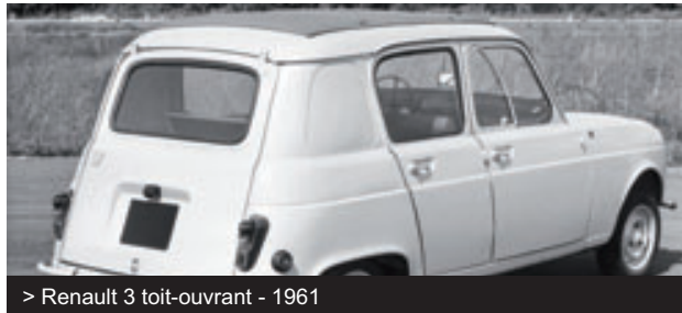
> Renault 3 toit-ouvrant - 1961

The entire range uses a three-speed gearbox.