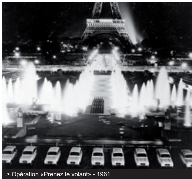
> Opération «Prenez le volant» - 1961