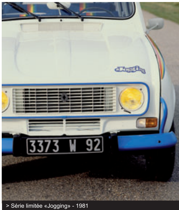
> Série limitée «Jogging» - 1981