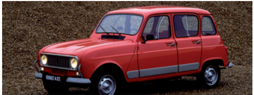
> Renault 4 GTL - 1978

La nouvelle Renault 4 GTL dispose du 1 108 cm 3 déjà vu sur la Renault 8. Le vilebrequin de ce moteur repose sur 5 paliers (contre 3 pour les autres moteurs de la gamme), gage de longévité