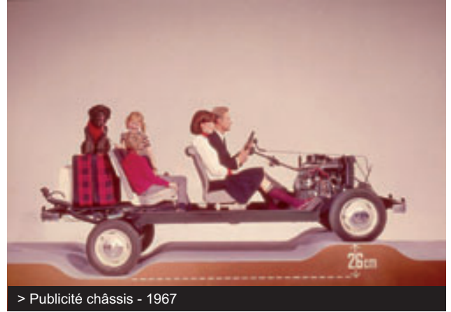
> Publicité châssis - 1967