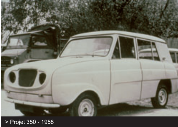
> Projet 350 - 1958