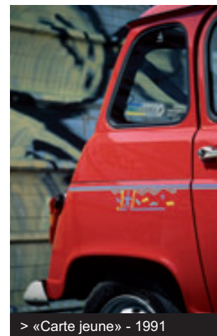
> «Carte jeune» - 1991

Le renforcement des normes anti-pollution vont sonner le glas de la Renault 4. Une dernière série spéciale de mille exemplaires est mise en production : la Bye-bye. Dernière version de la Renault 4, basée sur le modèle Clan, chaque modèle sort de l'usine avec sur son tableau de bord une plaque numérotée successivement de 1000 à 1.