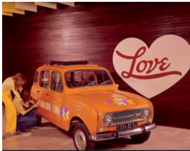
> Publicité 1973