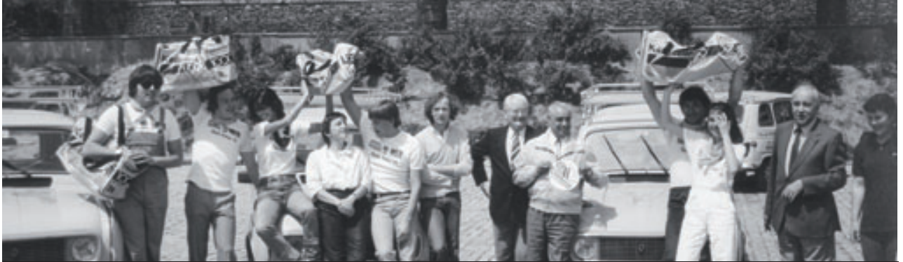
> Routes du Monde - 1983