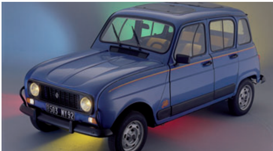
> Renault 4 «Sixties» - 1985