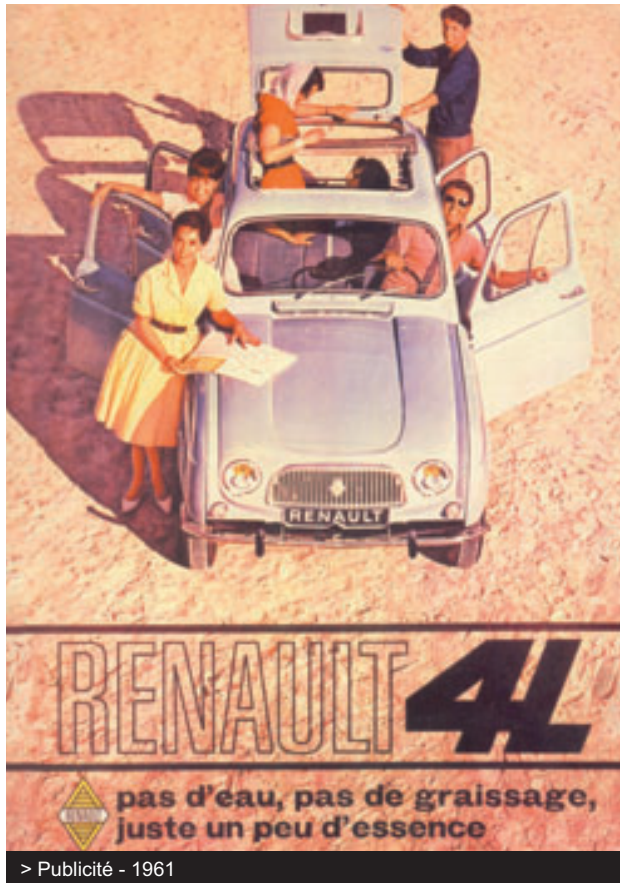
> Publicité - 1961