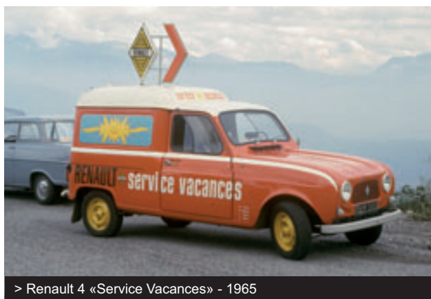
> Renault 4 «Service Vacances» - 1965