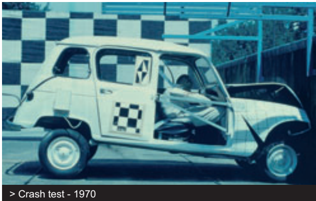
> Crash test - 1970