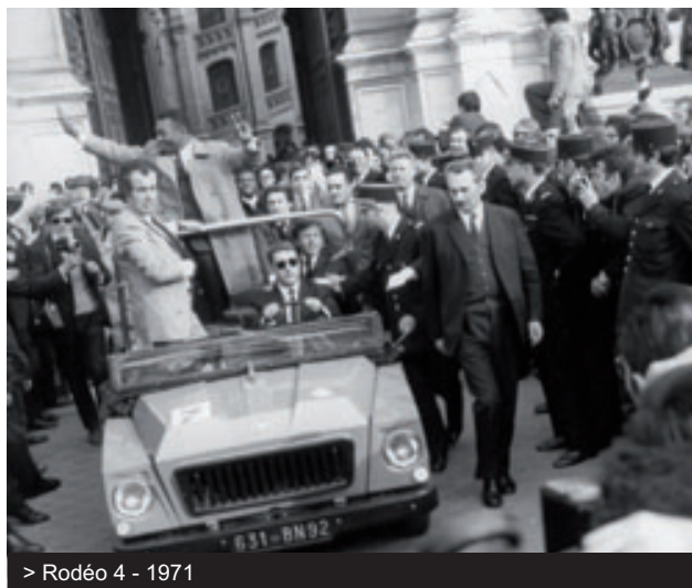
> Rodéo 4 - 1971

The radiator grille changes to a black plastic model with the Renault diamond in the centre.