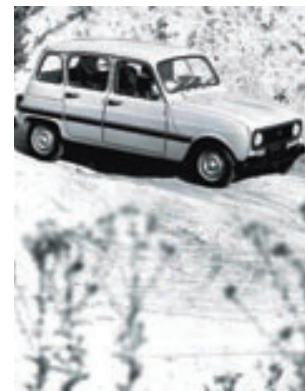
> «Safari» - 1976

From July, the dashboard of the Renault 5 equips the Renault 4 range. The 782 cc engine makes way for the 845 cc, which provides the same power as the 1 102 cc.