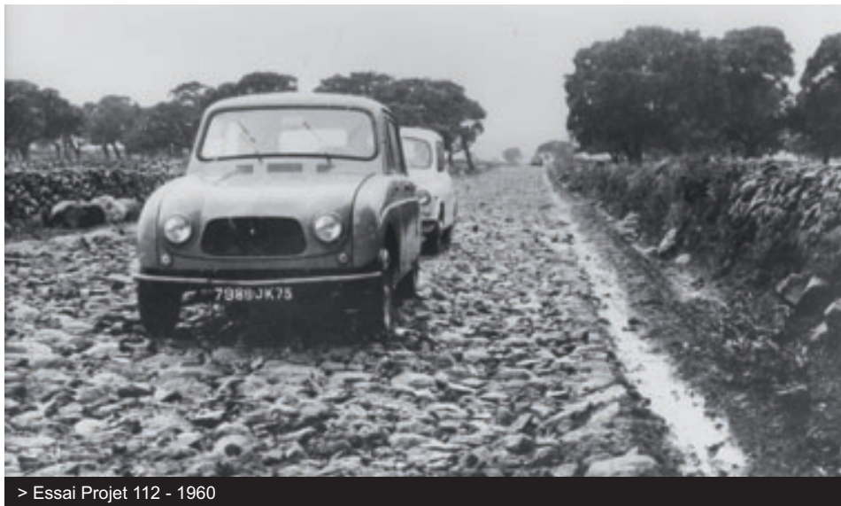
> Essai Projet 112 - 1960