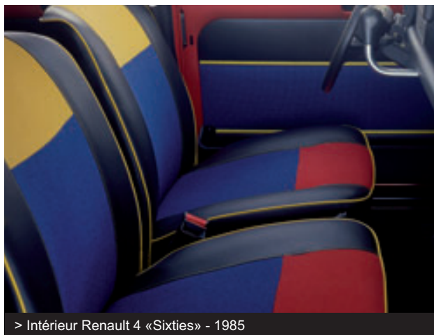
> Intérieur Renault 4 «Sixties» - 1985

Nombre d'exemplaires produits : 8 135 424