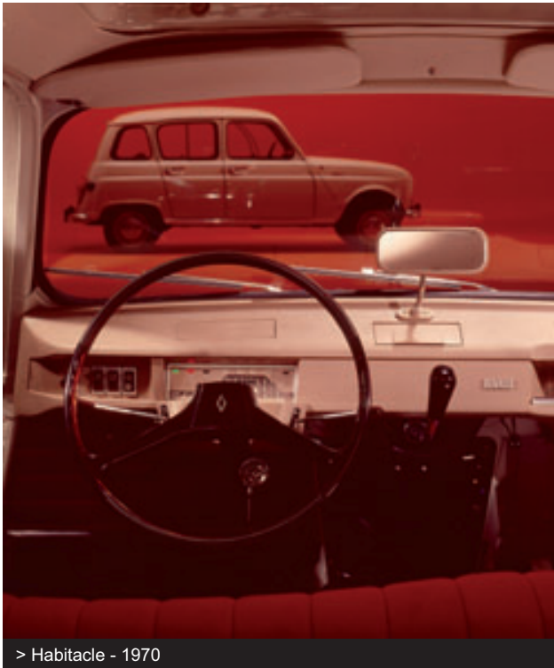
> Habitable - 1970