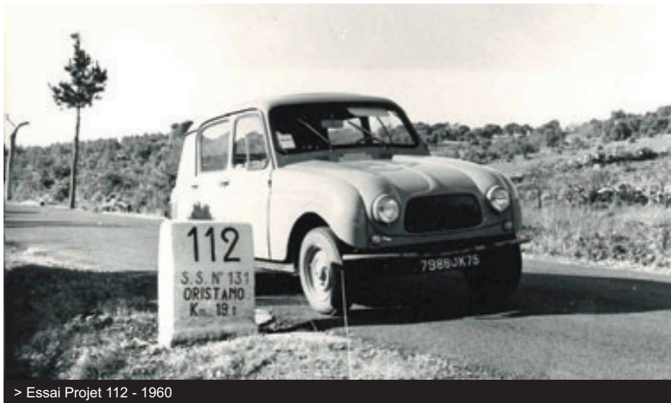
> Essai Projet 112 - 1960