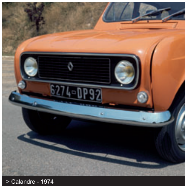
> Calandre - 1974