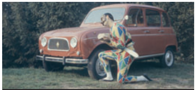
> Renault 4L - 1962