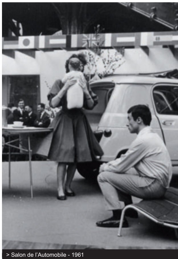
> Salon de l'Automobile - 1961