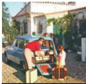
> R4 Super - 1962

Dans le même temps SINPAR (Société Industrielle de Production et d'Adaptation Rhodanienne) s'empare de la Renault 4 pour en faire une auto «tout terrain» à quatre roues motrices.