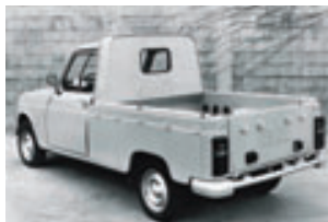
> Fourgonnette - 1965

The Renault 4 is finally given a 4th gear. September 1967 (model year 1968) : the Renault 4 has a wider radiator grille that envelops the headlights.