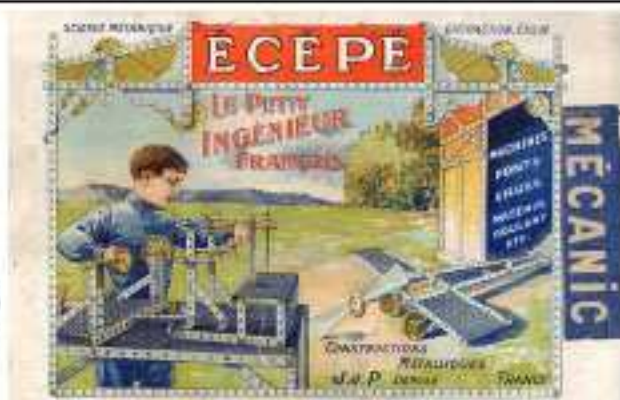
Surcharge MÉCANIC en 1920-21

Moteurs : après guerre, deux moteurs mécaniques en laiton